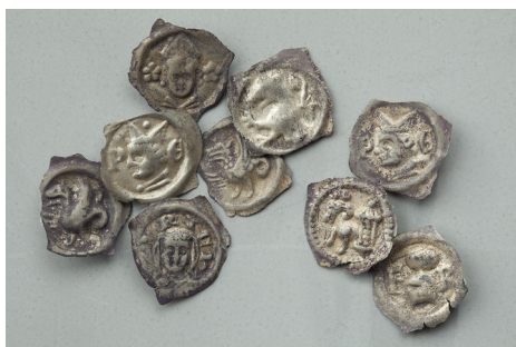
Münzen aus dem Fund von Nürensdorf, entdeckt im Juni 2015.

Nach der Datenaufnahme informieren wir die Kantonsarchäologie über Vorbestimmungen und notwendige Restaurationsarbeiten. Diese werden im Auftrag der Kantonsarchäologie durch Restauratorinnen und Restauratoren des Schweizerischen Nationalmuseums im Sammlungszentrum in Affoltern vorgenommen. In Absprache mit den Verantwortlichen beider Institutionen werden die Prioritäten für die Restaurierung festgelegt.