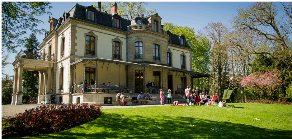
Erneuter Besucherzuwachs im Jahr 2015: An Aktionstagen wie dem Renaissance-Tag wurden Führungen, Kinderprogramm, aber auch der schöne Park der Villa Bühler rege genutzt.

Im vergangenen Jahr durfte das Münzkabinett mehr Besuchende als je zuvor verzeichnen: 3713 Personen besuchten das Museum und dessen Veranstaltungen. Das ist kein einmaliger Ausreisser, wie die Zahlen der letzten Jahre zeigen, sondern das solide Ergebnis einer fokussierten und wirksamen Öffentlichkeitsarbeit und zahlreicher Aktivitäten, die das Museum einem immer weiteren Kreis bekanntmachen.