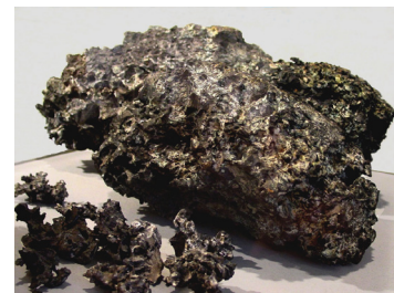
Die neue Ausstellung bietet viel Wissenswertes über keltisches Geld in der Schweiz und zeigt den spektakulären Potinklumpen von Zürich.

Im Januar wurde in Zusammenarbeit mit der Philatelie und der Landesarchäologie Liechtenstein eine kleine Ausstellung zu Briefmarken mit archäologischen und numismatischen Themen eröffnet. Im Februar und März besuchte das Münzkabinett das Schweizerische Kindermuseum in Baden mit einem Workshop und einer kleinen Präsentation; der Auftritt stiess auf grosses Interesse. Am 19. April beendeten wir die Ausstellung über Renaissance-Medaillen mit einem wunderbaren Renaissancetag mit Workshops zur Kalligraphie und zum Portrait, mit Musik, Essen und Führungen sowie museumspädagogischen Angeboten. Am 3. Mai waren wir am Römertag Vindonissa in Brugg vertreten.