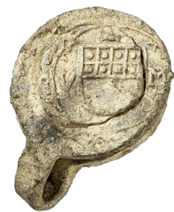
Unter den Funden von Rheinau sind die Tuchplomben besonders interessant. Dies ist eine Tuchplombe aus Ulm (15./16. Jh.).

Seit 1986 bearbeitet das Münzkabinett die Münzfunde des Kantons Zürich im Auftragsverhältnis. Ein grösseres Auswertungsprojekt «Rheinau, Prospektion» mit über 800 numismatischen Funden wurde im Manuskript abgeschlossen; die Publikation umfasst unter anderem den bedeutendsten Fund von religiösen Medaillen aus der Schweiz und eine grössere Anzahl von Tuch- und Warenplomben. In der zweiten Jahreshälfte wurde der neu entdeckte Münzschatzfund aus Nürens Dorf dokumentiert.