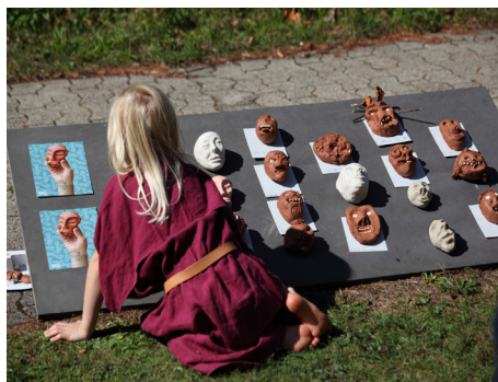
Das vielseitige Vermittlungsangebot des Münzkabinetts ist für Familien, aber auch für Schulklassen ein Magnet.

Das Vermittlungsangebot des Münzkabinetts umfasste nicht nur die Workshops der drei Vermittlerinnen der Museumspädagogik, sondern auch den Kinderkubus im Münzkabinett, die Kinder-Wissenssendung von «Radio Gwunder» bei Radio Stadtfilter mit vier Sendeterminen und spezielle, auf Kinder ausgerichtete Angebote, die für das Kindermuseum Baden, den Renaissance-tag und den Keltentag erarbeitet wurden. Neue Workshops im Rahmen der Angebote der Winterthurer Museumspädagogik beschäftigten sich mit dem Geld der Kelten und Römer, mit keltischen Ornamenten und römischen Göttern. Im Jahr 2015 fanden 60 Workshops mit insgesamt 1147 Kindern und Jugendlichen im Münzkabinett statt. Das entspricht fast 10 % des gesamten Angebots der Winterthurer Museumspädagogik.